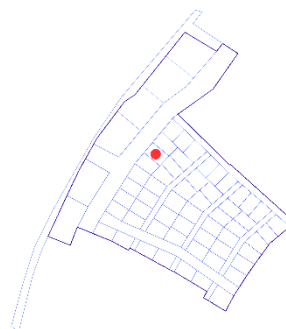
Joonis 1. Asukoht elamukvartalis